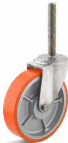
Unsere Lenkrolle für den Unterwasser-Einsatz mit Gewindezapfen zur Montage am Räumschild

Ergänzend zu den Bandagen-Rädern können wir Ihnen auch die erforderlichen Achsen nach einer Skizze oder Zeichnung anbieten.